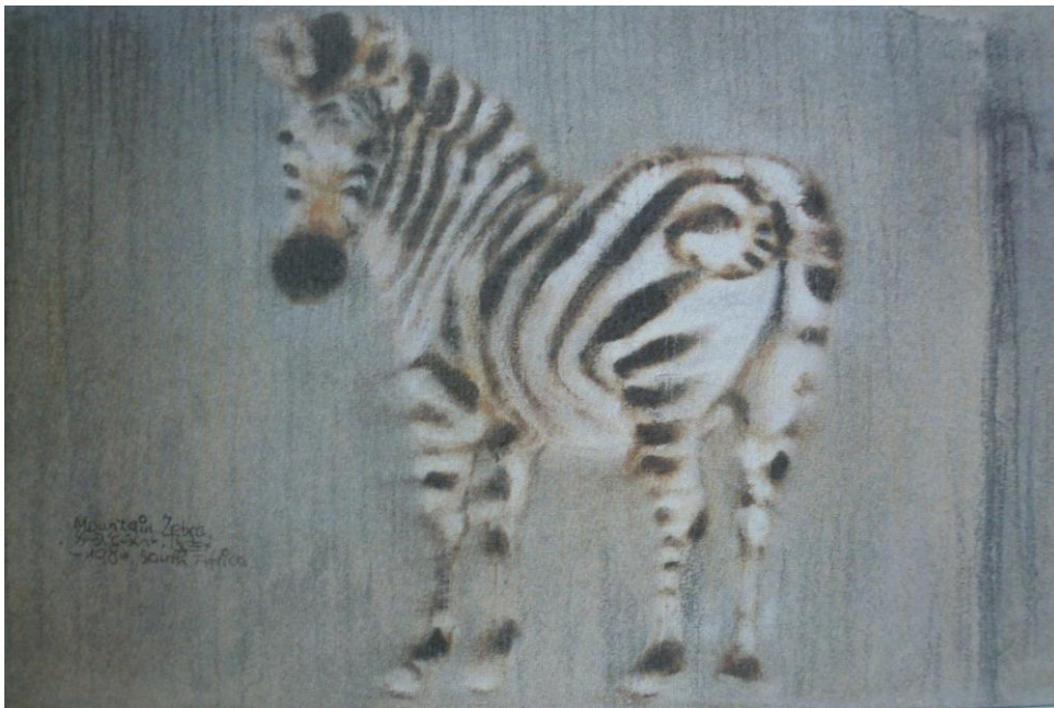
斑馬，1984，台北市立美術館典藏

劉其偉用擬人化的手法，營造出一場神奇有趣的昆蟲婚禮，他懂得世間最為票的細緻之處。我們是否也能像他一樣，用寬容、尊重的心，去對待萬物？(資料來源：壞人中的好人-劉其偉，鄭惠美著，雄獅圖書，2006/9/20 出版)