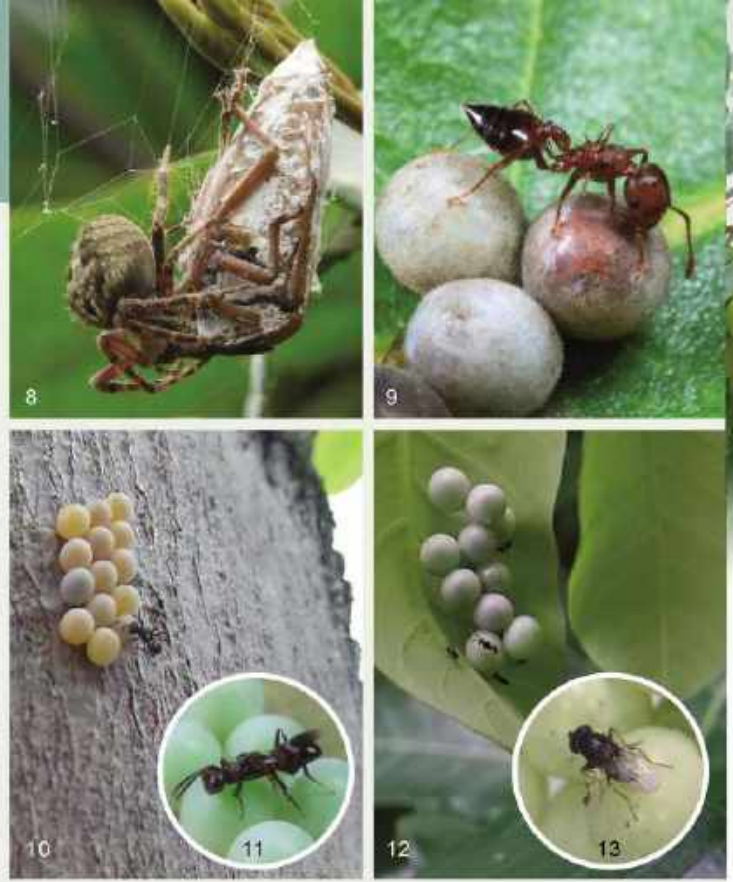
8：簷下姬鬼蛛捕食荔枝椿象。 9：取食荔枝椿象卵的懸巢舉尾家蟻。 10：形似螞蟻的平腹小蜂雌蟲，在一批荔枝椿象卵邊，用觸角挑選適合者並把自己的下一代注射進去。 11：平腹小蜂產卵管伸出並插入椿象卵。 12：跳小蜂走來走去，正產卵至荔枝椿象卵中。 13：跳小蜂近照。

108年起環境保護署已陸續核准防治荔枝椿象藥劑，用於非食用作物上。建議於4至6月間噴施於無患子樹冠最外層的鳥巢狀變形花序、花及果等處，即可有效降低無患子樹上的荔枝椿象數量。