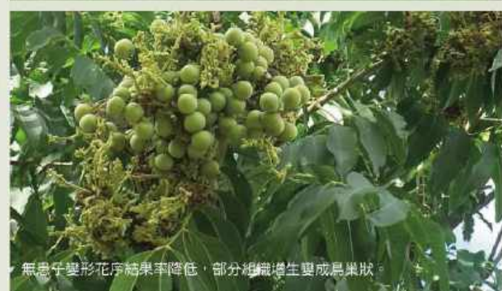
無患子變形花序結果率降低，部分組織增生變成鳥巢狀。