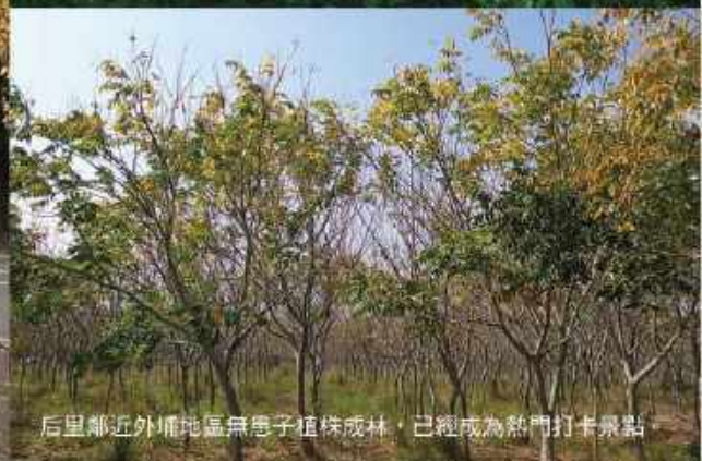
后里鄰近外埔地區無患子植株成林，已經成為熱門打卡景點。