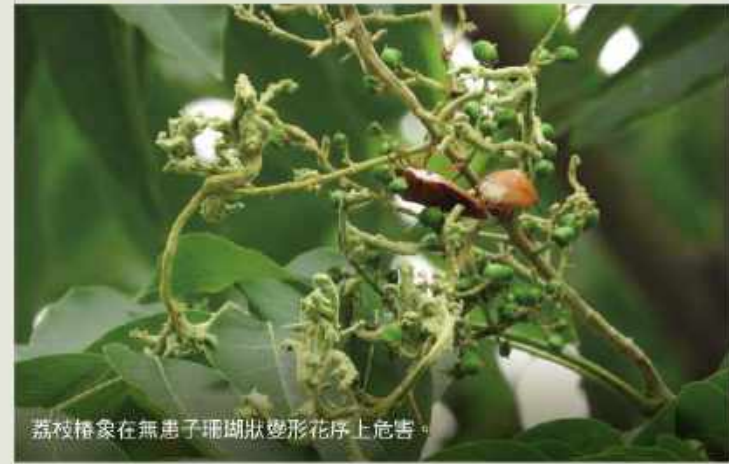
荔枝椿象在無患子珊瑚狀變形花序上危害。