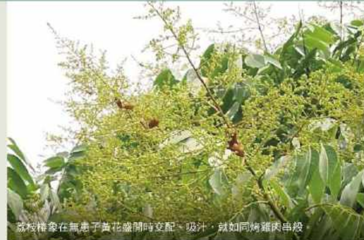
荔枝椿象在無患子黃花盛開時交配、吸汁，就如同烤雞肉串般。