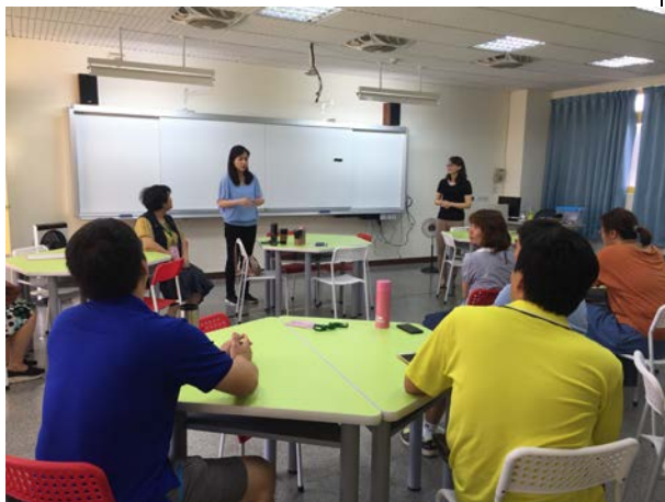
體健科股長歡迎大家(5/31)