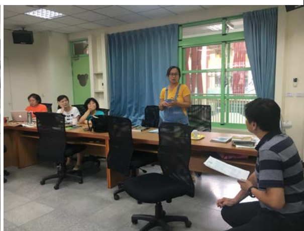
老師說明課程設計初步構想(8/2)