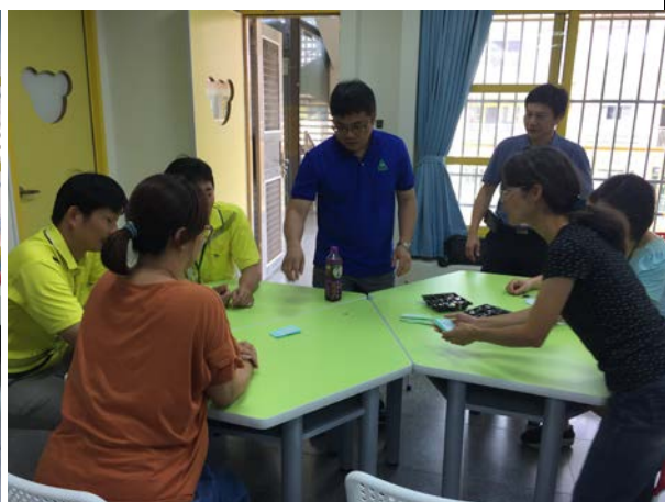
參與教師議題討論(5/31)