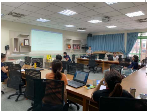
活動設計教案內容說明(8/3)