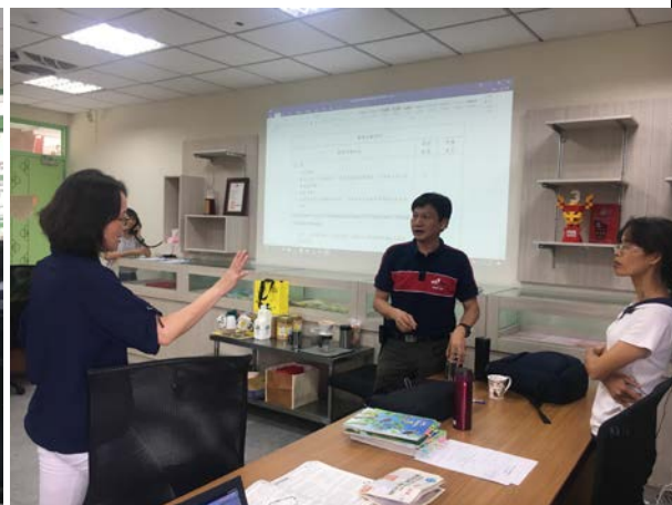
專家學者與老師討論課程設計構想(8/3)