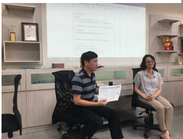
專家學者說明課程設計理念(8/2)