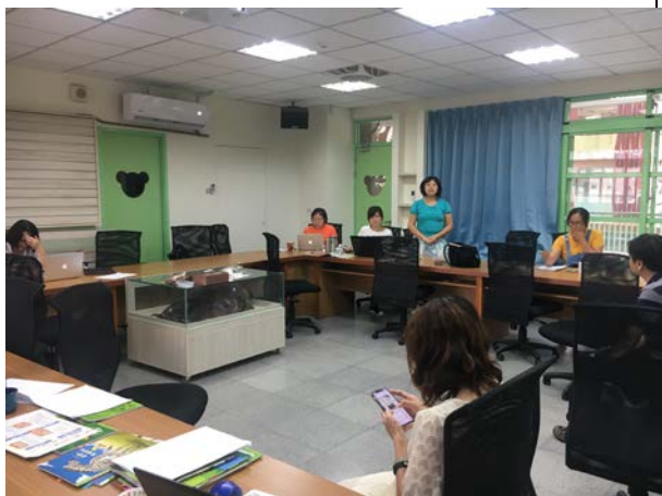
老師說明課程設計初步構想(8/2)