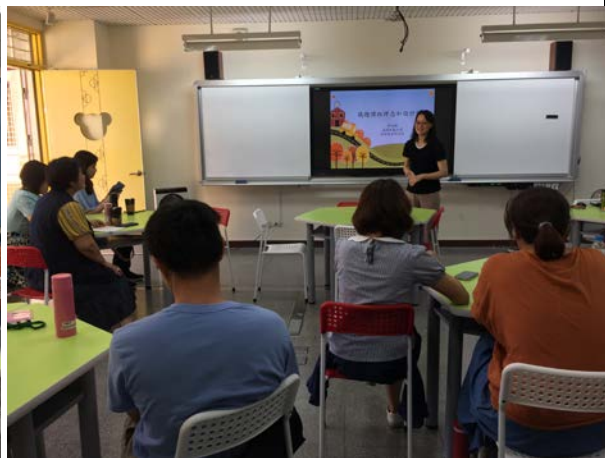
教授介紹環境教育課程設計意涵(5/31)