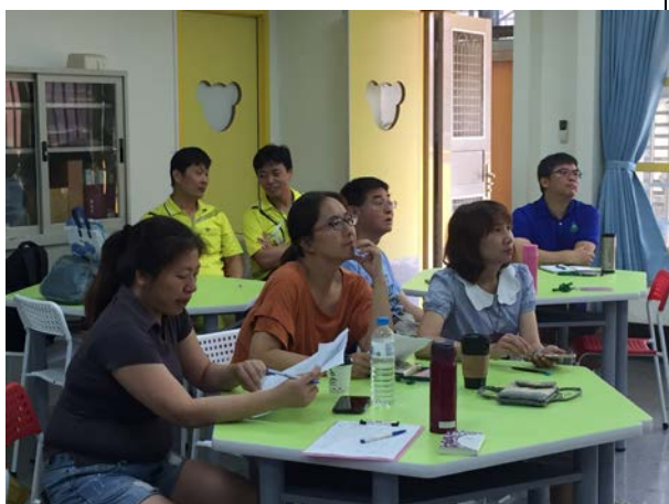
參與教師仔細聆聽(5/31)